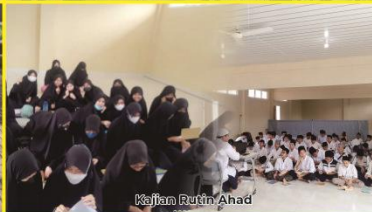
Kajian Rutin Ahad